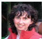
Vice - Présidente Trésorière

Vous trouverez ci-après la composition du conseil d'administration 2010-2011